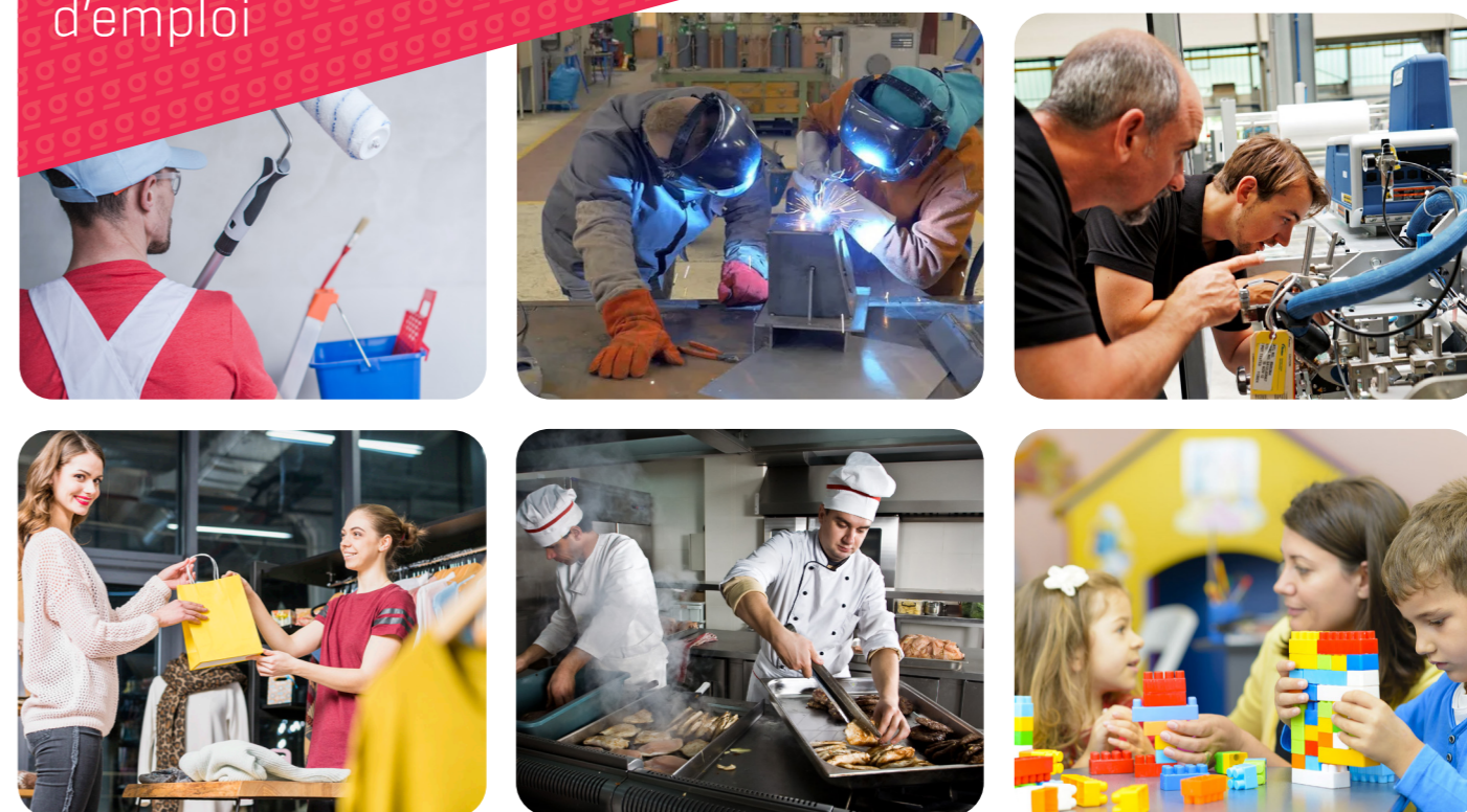
Formation financée par la Région Nouvelle-Aquitaine : le Greta Poitou-Charentes est mandaté par la Région au titre de l'habilitation de service public

Conception Greta Poitou-Charentes / Mai 2024