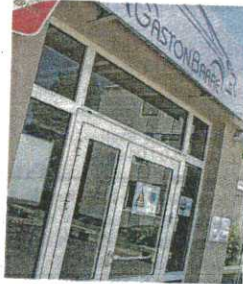
Le Greta s'affiche aux portes des lycées Gaston-Barré et Paul-Guérin.

Si ses anciens locaux vont être détruits, cela ne signifie pas que le Greta niortais a disparu. Au contraire, il forme plus d'un millier d'adultes chaque année.